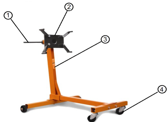
Fig. 2: Descrierea dispozitivului

Imaginile din acest Manual de utilizare pot fi diferite față de dispozitivul original.