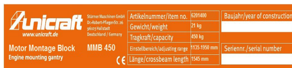
Fig. 1: Eticheta cu specificații stativ de montaj pentru motoare MMB 450